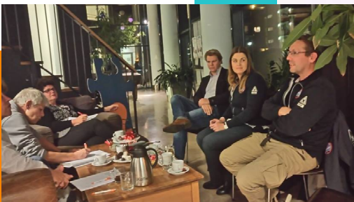
Toneelvereniging Hildering in gesprek met de jury