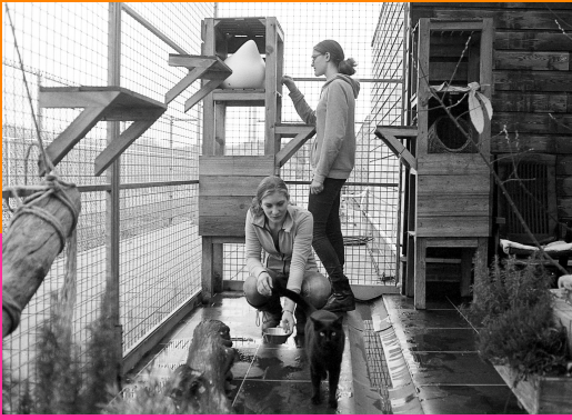
Jongeren aan het werk in het dierenasiel.