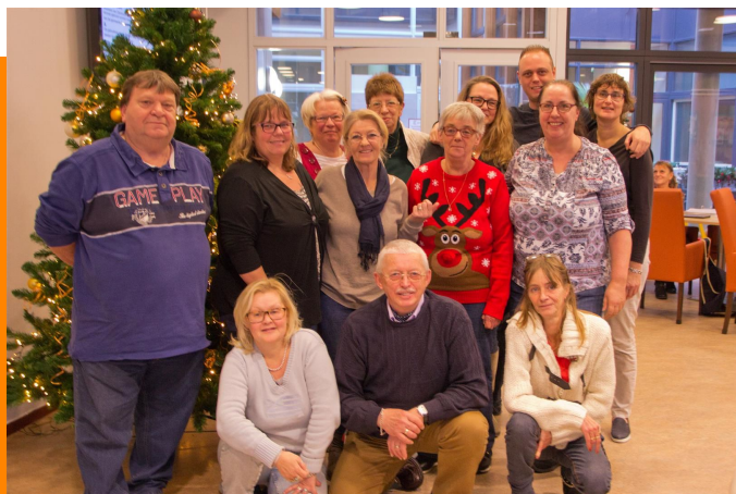
Het vrijwilligersteam van OOK Samen werkt soms 3x per week!

Een enkele keer per jaar heeft VIP, in samenwerking met de Zandvoortse Courant de VIP vacature van de maand . Contactgegevens, informatie en logo van de vrijwilligersorganisatie komen in de spotlights. Hierin wordt ook gebruik gemaakt van samenwerking tussen verschillende organisaties wanneer zij eenzelfde type vrijwilligersvacature hebben.