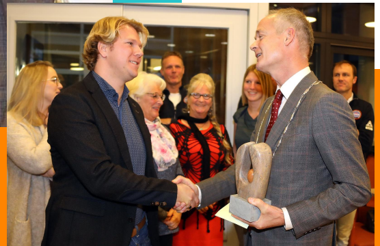
De publieksprijs ging naar de Toneelvereniging Hildering, zij hadden de meeste stemmen (en ook de jongste leden).